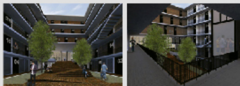
las imágenes son orientativas